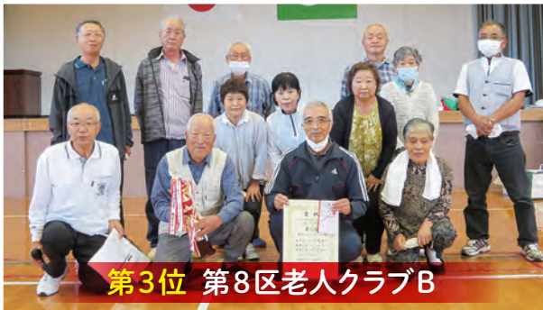
第3位 第8区老人クラブB