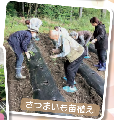
さつまいも苗植え