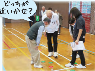
どっちが近いかな?