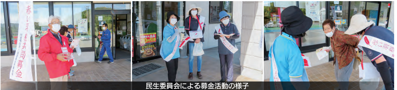
民生委員会による募金活動の様子

共同募金で集められたお金が川内村で具体的に使用されているかご存じでしょうか？ 主に地域活動や団体に助成され、様々な事業に使用させていただいています。