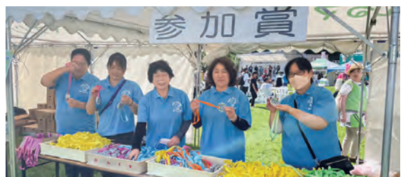
かわうちマラソンホラ ンティアの様子

新型コロナウイルスは、季節性インフルエンザなどと同じ「5類」に移行しました。それに伴い、社協での活動の幅も広がり、住民の方々と交流する機会が増えました。今後ともサロンや各事業でお会いした際はよろしくお祈りします。